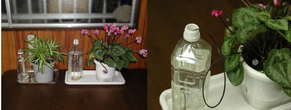
設置例 (左が全体、右設置状況)